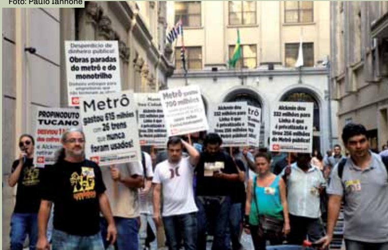
Manifestação dos metroviários em frente à sede do Metrô

Mostrando que não tem a mínima preocupação com os trabalhadores, Alckmin e a direção do Metrô querem mudar a data de pagamento, suspender férias e parcelar e reduzir a PR (Participação nos Resultados) dos trabalhadores.