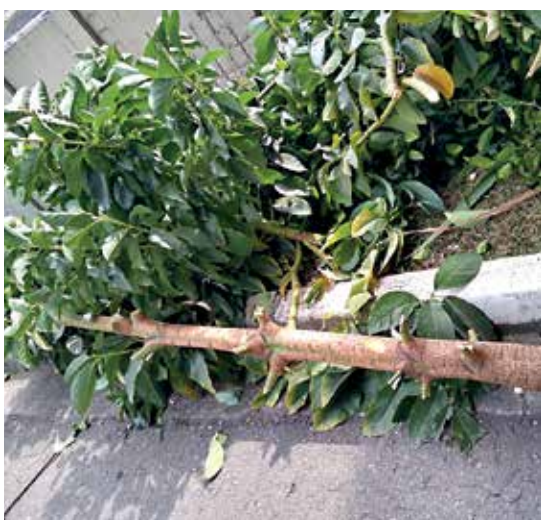
Plantas e árvores mantidas pelos metroviários foram arrancadas pelo GRI

É importante registrar que enquanto as demissões estavam sendo realizadas, o Sindicato buscou tratativas com o Metrô, que simplesmente negou qualquer negociação. As demissões somente cessaram depois que o Sindicato se reuniu com o Secretário de Transportes e, por determinação deste, o Metrô parou de demitir, o que evidencia o caráter arbitrário e político das demissões.