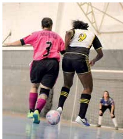
Finais do Campeonato de futsal feminino e masculino do Sindicato