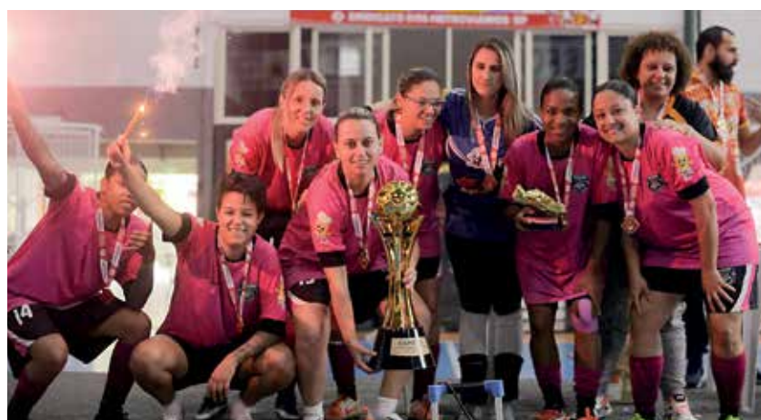
Primeiro título do futsal feminino foi para o T&P