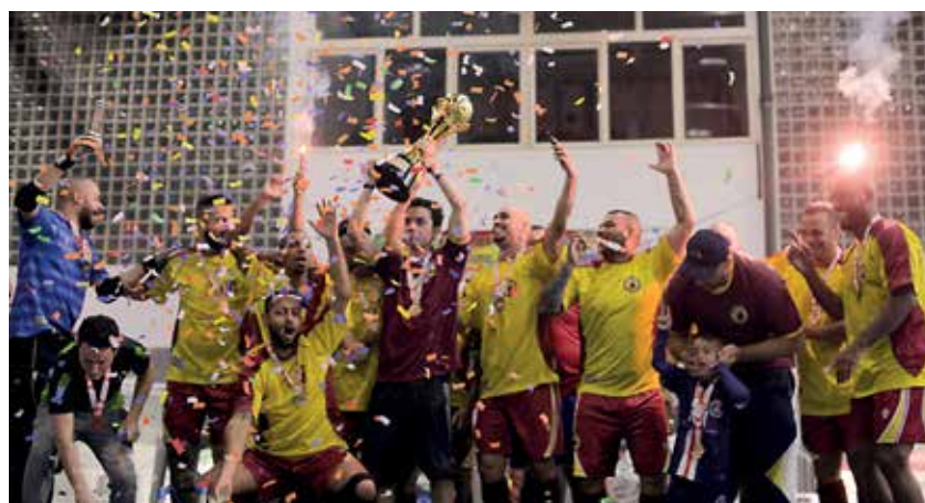
Os campeões do futsal masculino: Bons de Copo