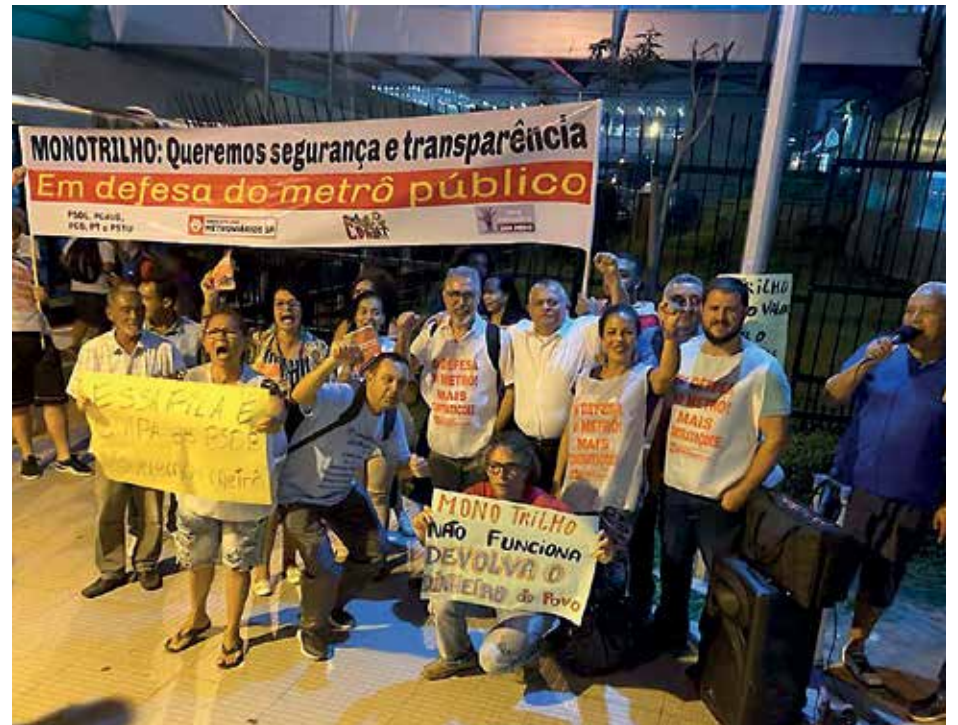
Manifestação em 12/3 na estação Vila Prudente

O Sindicato participou de manifestação, no dia 12/3, na estação Vila Prudente, e pede explicações e transparência do governo estadual sobre as condições de equipamentos. Defendemos o transporte público e estatal, mais contratações de funcionários e cabines de operadores de trem. É necessária segurança para usuários e funcionários.