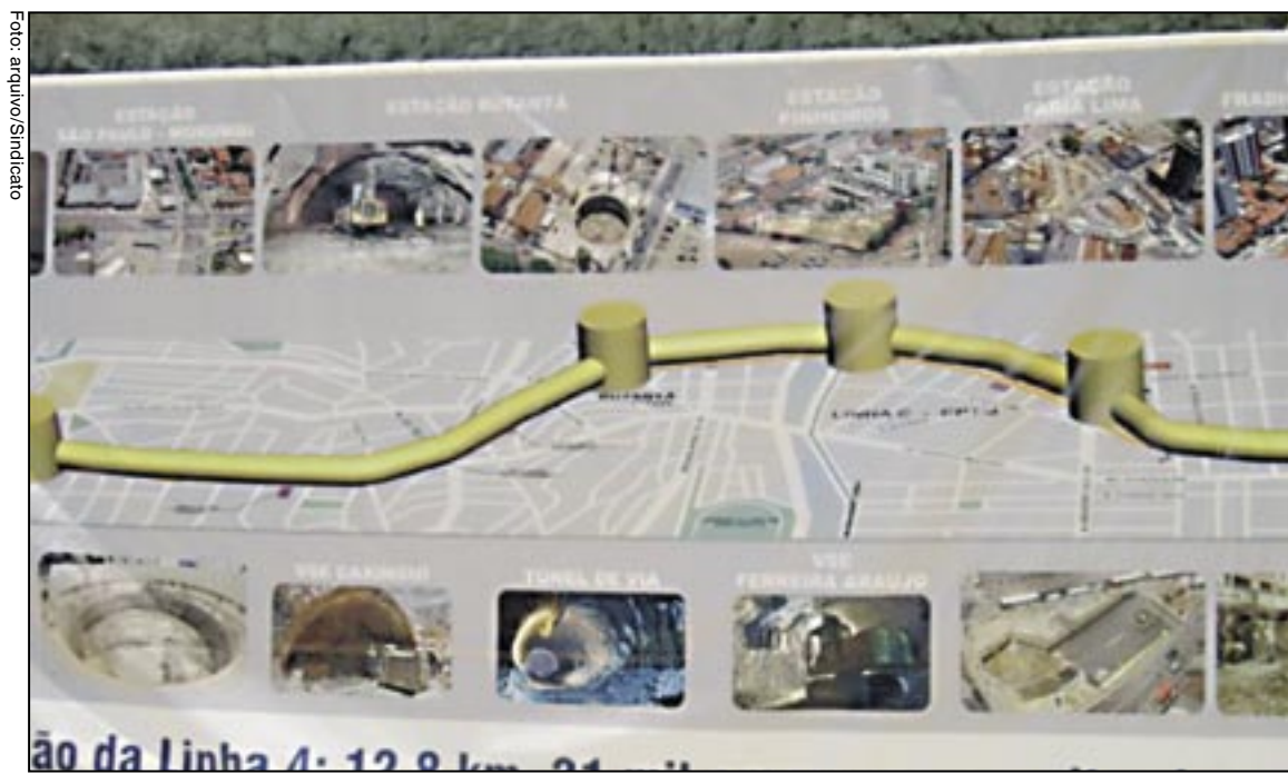
Painel com parte do traçado da Linha 4 - Amarela

Nos contratos anteriores ele discutia com os engenheiros. Agora eles não têm muita participação, fazem coisas pela produção, e os técnicos do Metrô muitas vezes vão saber depois de executado. Na