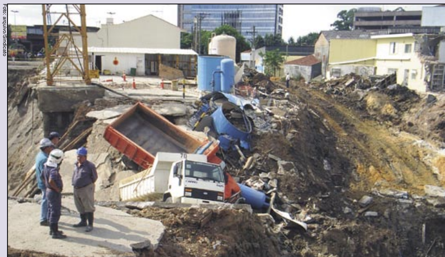
Vista da cratera aberta na futura estação Pinheiros

09/08/2006 – Metrô e governo estadual tentaram realizar audiência pública