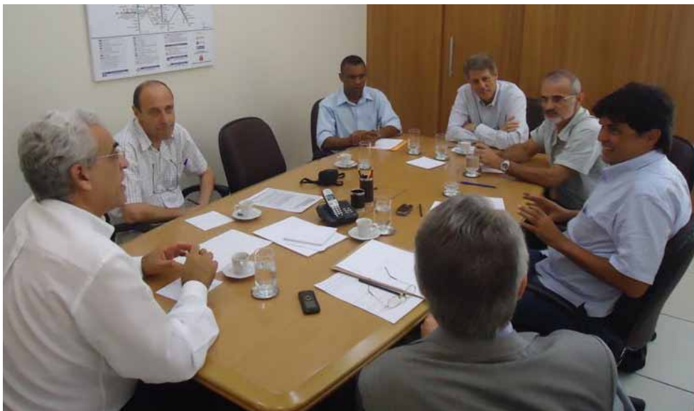
Secretário dos Transportes Jurandir Fernandes recebe o Sindicato, que propõe a revisão do plano.

Após a reunião com o Secretário dos Transportes Metropolitanos Jurandir Fernandes no dia 28 de dezembro, divulgada no bilhete 406 (foto), o Sindicato, representado pelo presidente Altino de Melo Prazeres, além de representantes de centrais sindicais, reuniram-se no dia 13 de janeiro com o governador do Estado de S. Paulo, Geraldo Alckmin. O Sindicato apresentou uma carta (veja íntegra no site) solicitando a suspensão do plano de carreira imposto pela Cia.; a volta do transporte subsidiado para a população do estado; expansão do sistema metroviário; a volta dos demitidos em 2007 etc.