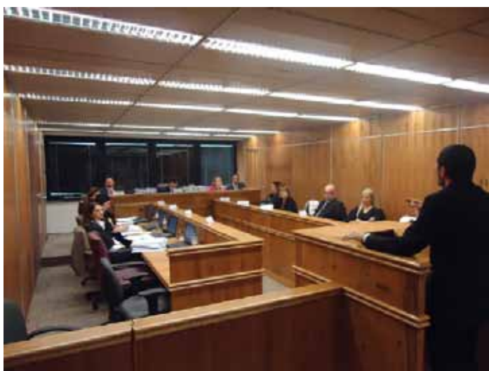
Advogado do sindicato interpondo agravo de petição derrotado no TRT

Foi criada uma grande expectativa no fim da gestão anterior do Sindicato, ao divulgar para a categoria que estaria em vias de obter o pagamento da multa de R$ 3.360.000 pelo atraso no cumprimento da decisão do TST por parte do Metrô.