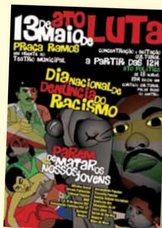
Cartaz de divulgação do ato

É preciso abolir os problemas do racismo, miséria, desigualdade, exploração e genocídio há tanto tempo enfrentados pela população pobre e negra! Diga não ao racismo!