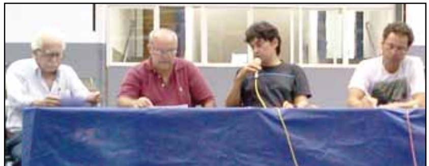
Mesa que abriu os trabalhos da assembleia da categoria no dia 5/2

Nossa disposição de luta e a divulgação de que os seguros da CPTM já haviam sido contemplados com o pagamento correto de 30% de adicional de periculosidade garantiu o imediato pagamento aos ASs.