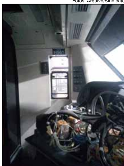
H 56 na Linha 86 b2 no PAT: canibalizado para suprir peças de outras composições

40 trens da frota H (CAF). Alguns deles foram aproveitados pelo Metrô. A CAF foi a vencedora. Além da corrupção em manipular uma concorrência, houve a malversação do dinheiro público, devido aos problemas da escolhida frota H como a falta de peças de reposição.