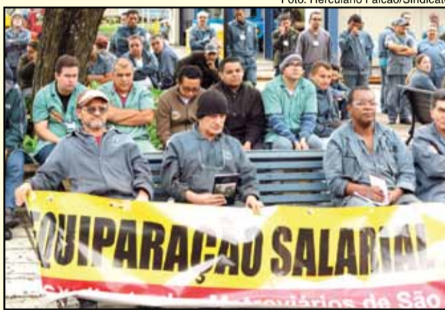
Setorial realizada no Pátio Jabaquara na Campanha Salarial 2012

A empresa na verdade está enrolando os trabalhadores. Não está cumprindo o acordo que assinou no Tribunal Regional do Trabalho (TRT). Todos os 2.266 que pedem