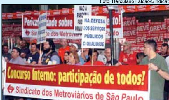
Ato em frente ao prédio do Cidade II, Campanha Salarial 2011

E, também, uma reunião com a empresa está sendo solicitada.