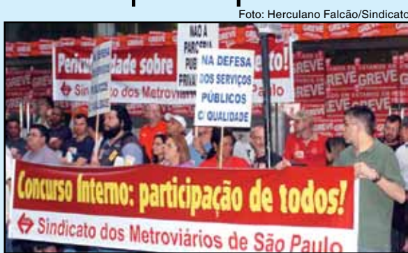
Ato em frente ao prédio do Cidade II, Campanha Salarial 2011

E, também, uma reunião com a empresa está sendo solicitada.