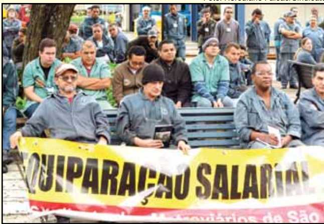
Setorial realizada no Pátio Jabaquara na Campanha Salarial 2012

A empresa na verdade está enrolando os trabalhadores. Não está cumprindo o acordo que assinou no Tribunal Regional do Trabalho (TRT). Todos os 2.266 que pedem