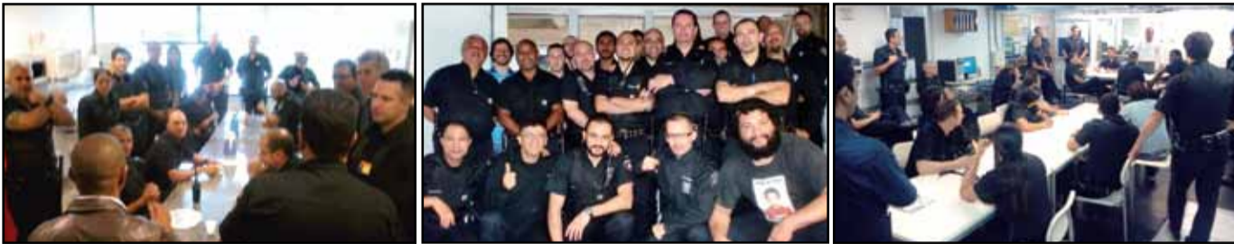
AS's mobilizados, no dia 4/10, não realizaram o Embarque Melhor. Na foto maior: AS's dos postos de PSE tarde. Da esquerda para a direita: AS's dos postos de TTI, de Brás manhã e de PSE tarde