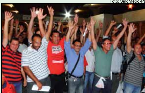
Metroviários de PE decidem greve de 24 horas

Os companheiros exigem investimentos públicos no setor. Eles criticam o sucateamento do metrô de Recife como justificativa à privatização. O governo federal, visando a entrega do transporte público para a iniciativa privada, busca a estadualização