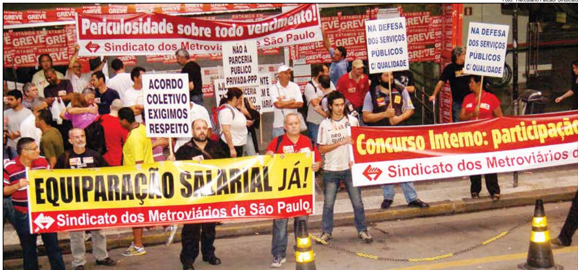
Ato em frente ao Cidade II realizado em 2011