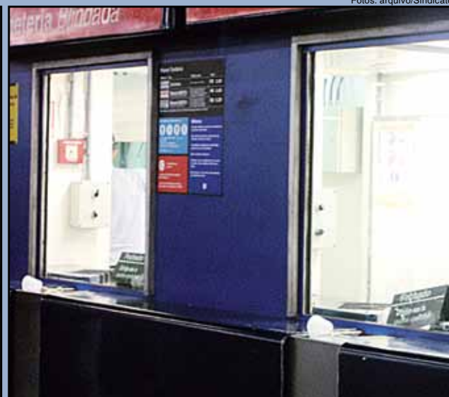
Ironia: sem intercomunicador, Sindicato improvisa “telefone sem fio” para o atendimento