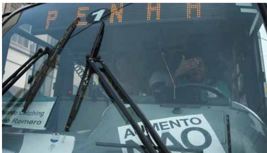
Motorista adere à mobilização

As MPs atacam e reduzem direitos referentes ao seguro-desemprego, auxílio-doença, pensão por morte e o abono do PIS-Pasep. Dilma também vetou o texto aprovado pelo Congresso Nacional que corrigia em 6,5% a tabela do IRPF, o que significa aumento automático dos descontos nos salários.