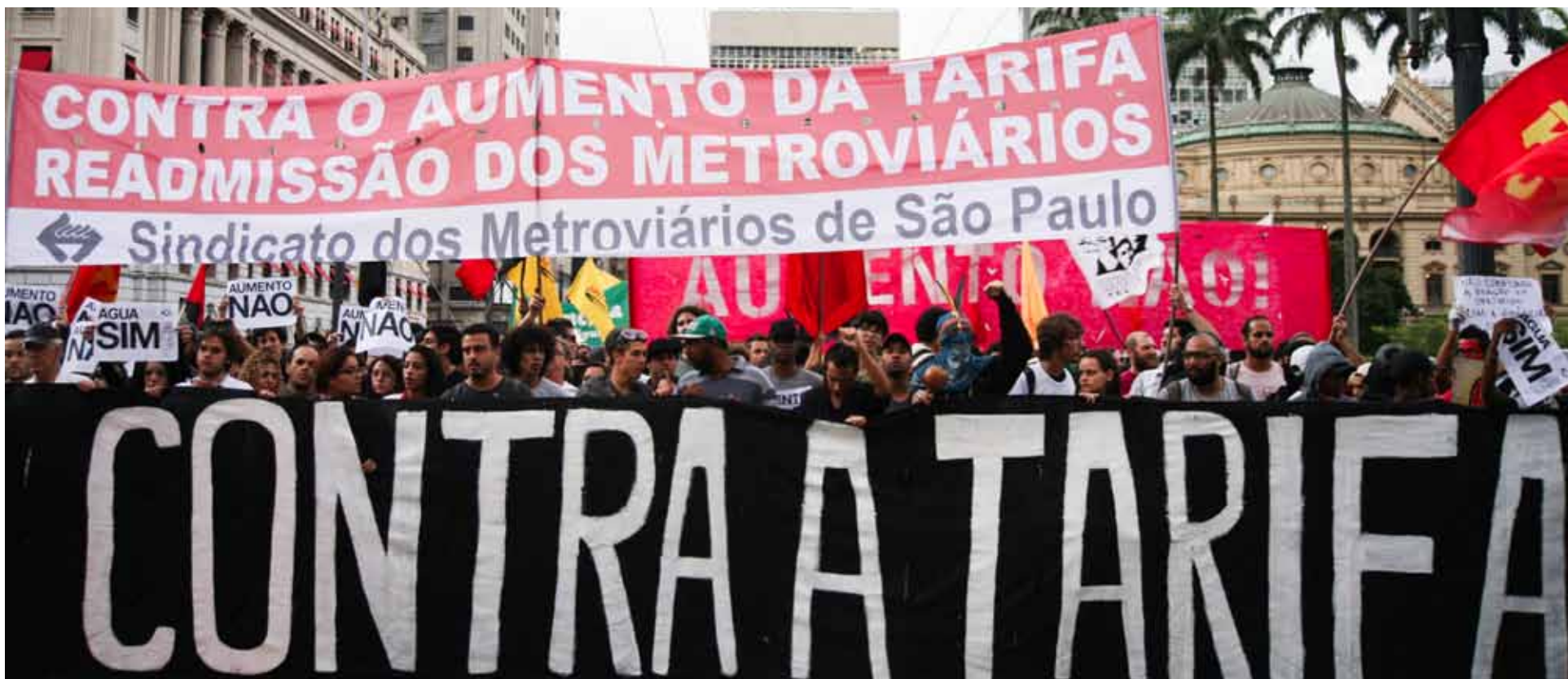
Metroviários participam do 4º ato contra o aumento da tarifa em 23/1

Porque o aumento para R$ 3,50 é abusivo. Se o aumento da passagem ocorresse de acordo com a inflação dos últimos 20 anos, a passagem não chegaria nem a R$ 2 (como aponta o gráfico ao lado do portal Terra). Mas Alckmin e Haddad promoveram este aumento para tirar cada vez mais a responsabilidade do governo e da prefeitura com o transporte público. No Metrô e na CPTM o reajuste não tem servido para melhorar a qualidade, mas sim para desvios milionários das obras e dos equipamentos comprados para a “modernização” do sistema, como ficou revelado com o Propinoduto Tucano.