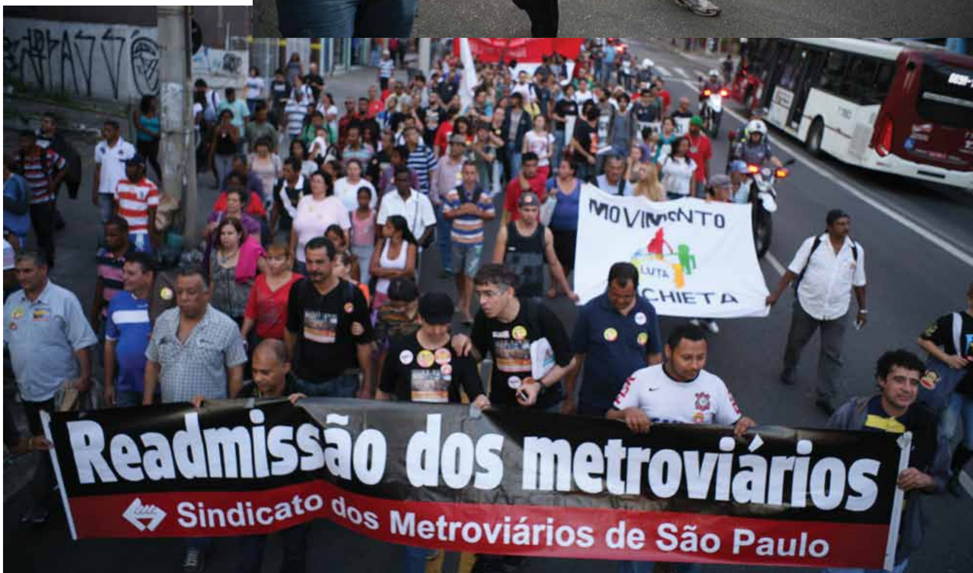
Acima, metroviários foram às ruas pela readmissão em janeiro; abaixo, metroviários caminharam até a Assembleia Legislativa, em agosto de 2014