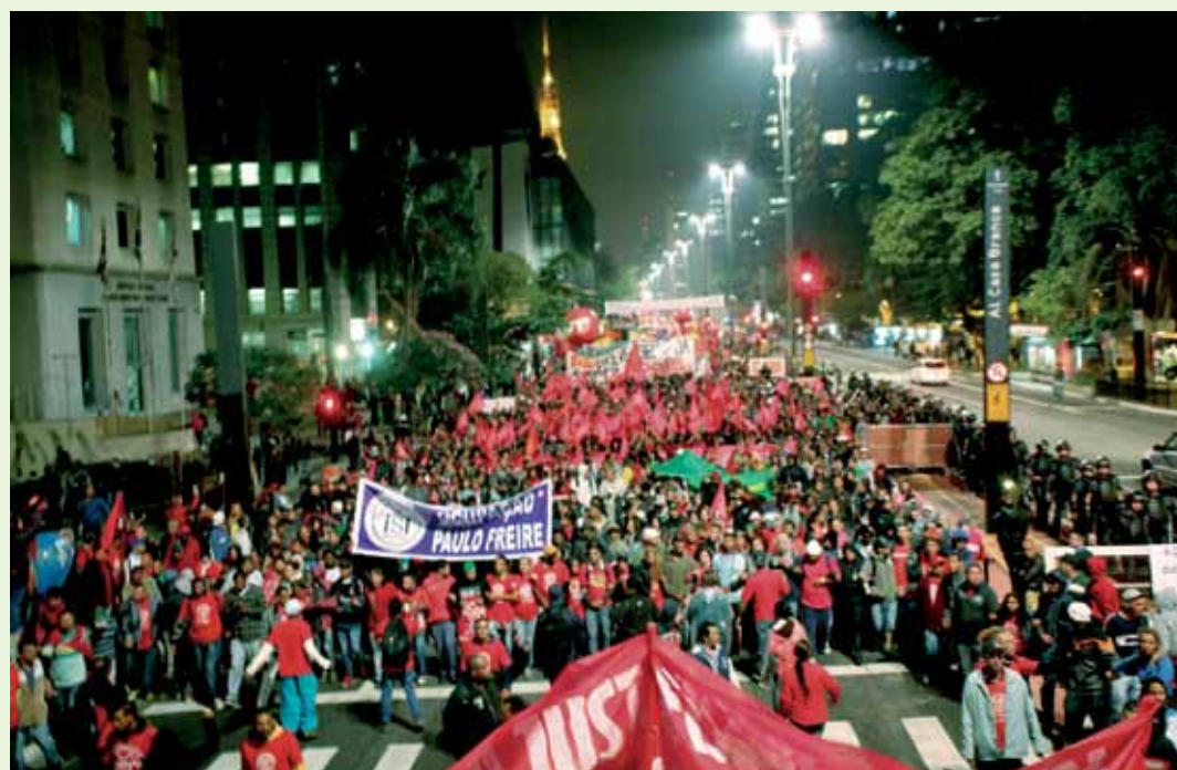
Trabalhadores saíram às ruas contra o ajuste, cortes no orçamento e a terceirização