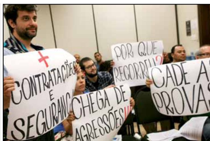
Contratação de mais funcionários foi uma das principais reivindicações da Campanha Salarial 2015