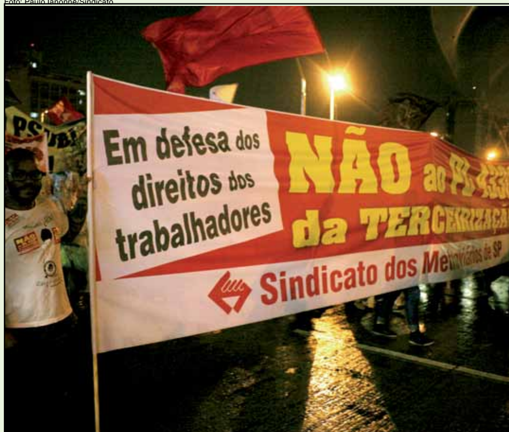
Metroviários não aceitam a terceirização

A terceirização ainda assombra os trabalhadores. Em tramitação no Senado, o projeto agora segue com o nome de PLC 30/2015 e passará por quatro comissões antes de ir à votação no plenário da casa.