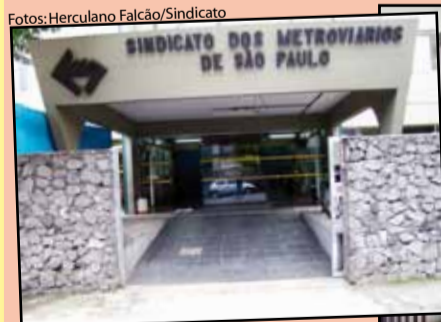
Portão de acesso à diretoria e administração do Sindicato