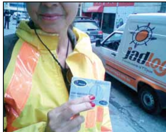
Funcionários da CET: dificuldades para encontrar estabelecimentos conveniados