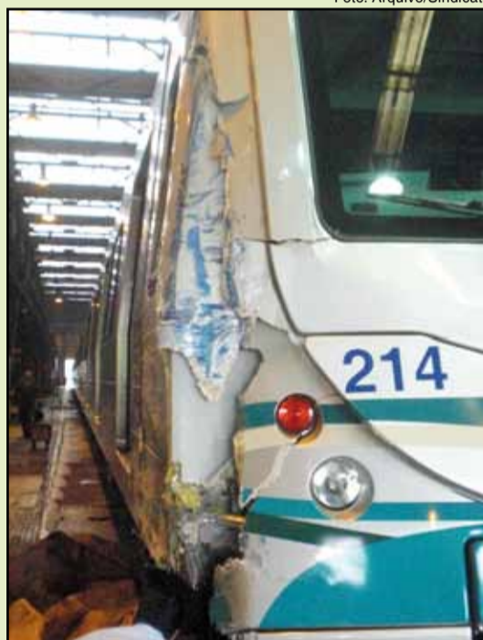
Composição que colidiu em 2009, na transferência para a Linha 2

21/SET – Linha Vermelha ficou paralisada por 2 horas e os usuários seguiram andando pelos trilhos. Em meio à campanha eleitoral, governador alegou sabotagem, mas a perícia técnica do Instituto de Criminalística apontou