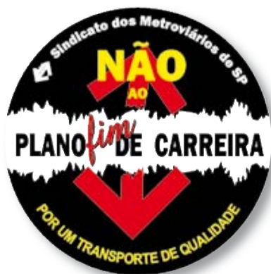
Boton da Campanha

O uso do boton a partir desta segunda-feira, 20/12, será fundamental na campanha por um Plano de Carreira que valorize os metroviários e o transporte público. Participe desta luta por um direito que é seu! Boton a partir de segunda-feira!