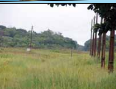
Diretores do Sindicato na prefeitura de Ilha Comprida e proximidade do terreno: mata fechada

Diretoria do Sindicato descobre prejuízo de décadas de IPTUs desnecessários