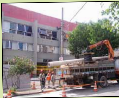
Poste em frente ao portão do estacionamento sendo retirado

O Sindicato encaminhou os procedimentos necessários para a retirada do poste, o que aconteceu em meados de fevereiro, garantindo o acesso à entidade de forma segura.