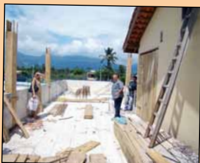
Obra na laje da Colônia em Caragua

Em breve o portão de entrada também estará automatizado para maior comodidade da categoria.