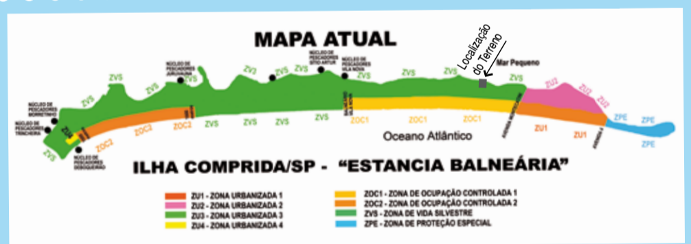
Mapa de Ilha Comprida e localização do terreno em Zona de Vida Silvestre: desperdício!