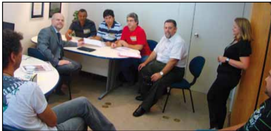
Reunião em 24/02 com o presidente da Cia e o GRH, quando foi apresentada a proposta da PR