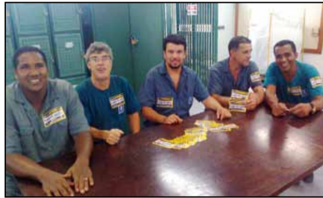
Metroviários participam do dia de Mobilização contra o Plano de Carreira imposto pela empresa