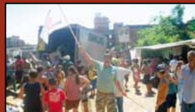
Comitiva entrega cestas básicas à população de Santo André