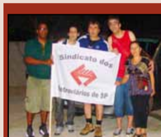
Entrega dos donativos em Nova Friburgo: delegação (acima) enfrenta 26 horas de viagem com mais de 1.600 Km rodados e 17 horas de estrada para levar conscientização e solidariedade à população