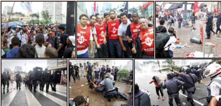
Manifestação contra o aumento das tarifas reprimida pela violência policial

Na manifestação realizada pelos estudantes e diversas entidades dos movimentos sociais contra o aumento das tarifas do transporte público, dia 17/02, os governos de Alckmin e Kassab deram mais uma demonstração da sua forma antidemocrática, violenta e repressora de governar.