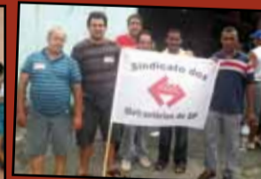
Donativos entregues no Jardim Pantanal, Zona Leste de São Paulo