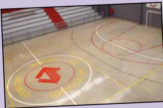
Quadra com o piso inadequado: iminência de acidentes

É o Sindicato corrigindo o passado e garantindo a segurança da categoria.