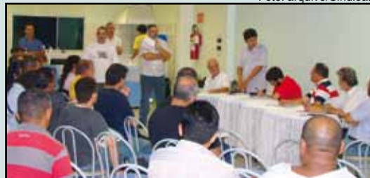
Reunião do dia 23/02, para organização do Fórum