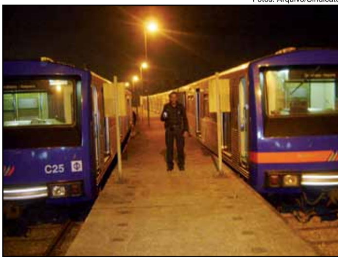
Agentes de Segurança são submetidos a péssimas condições de trabalho para vigiar os trens contra os pichadores

Como se não bastasse ser submetidos a condições de trabalho precárias, sem banheiro, sem local adequado para refeições, com a via energizada, sujeitos à intempéries e com