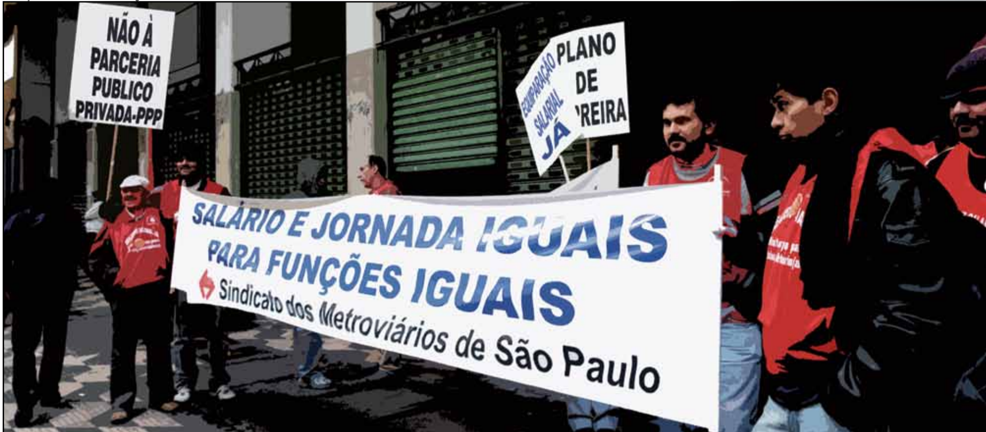
Ilustração: com base em fotomontagem