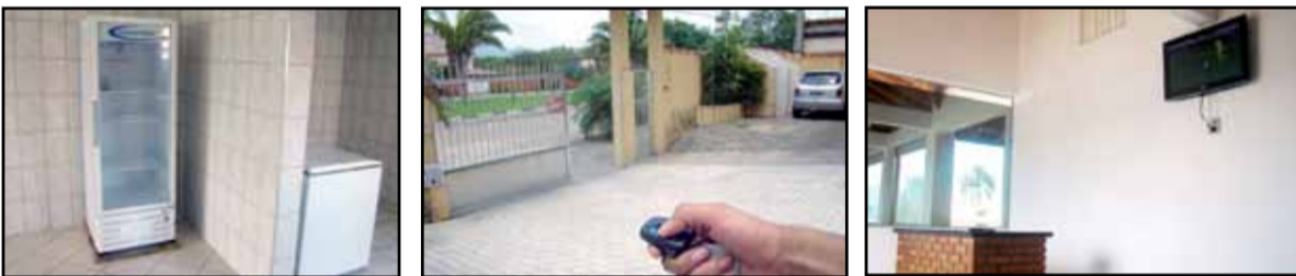
Cozinha coletiva com todos equipamentos, portão elétrico e sala de TV com balcão.