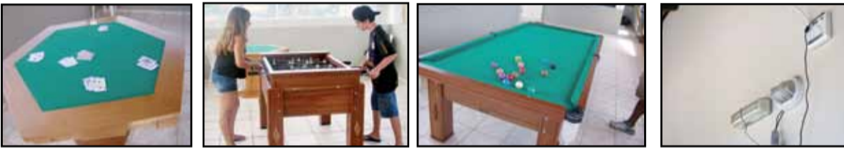
Colônia de férias equipada! Sala de jogos, wireless com rede disponível para acesso à Internet.