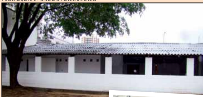
Área de Lazer do Sindicato