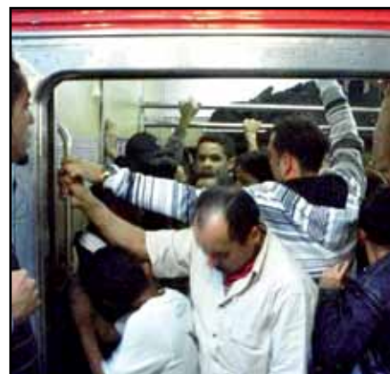
A população paga altas tarifas e sofre com a superlotação e péssima qualidade dos transportes

Mais uma vez o governador do estado e os prefeitos da capital e dos municípios da região metropolitana de São Paulo aumentaram as tarifas do transporte!