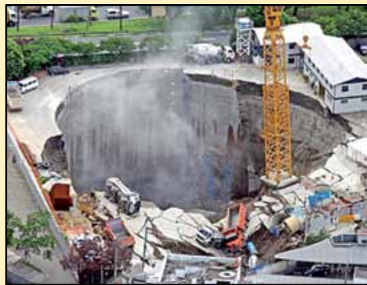
Acidente na estação Pinheiros - L4 Amarela causou a morte de 7 pessoas

Não bastasse a empresa ter que desembolsar quase nada, ainda tem garantido o recebimento de uma quantidade mínima de usuários