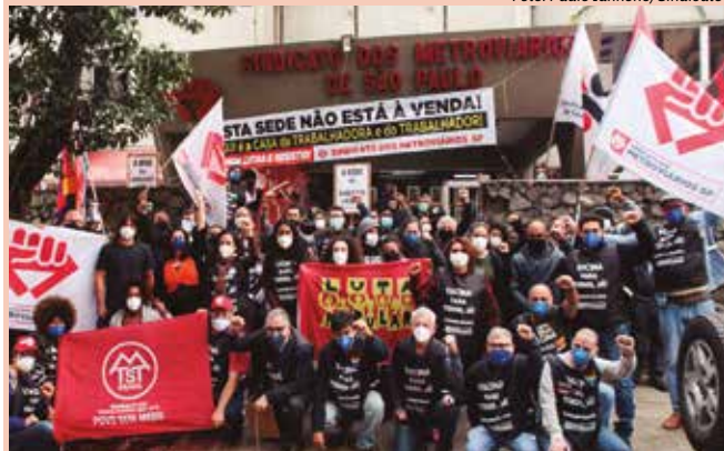
Manifestação dos metroviários e movimentos sociais em defesa da sede do Sindicato dos Metroviários de SP