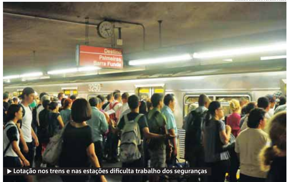
► Lotação nos trens e nas estações dificulta trabalho dos seguranças