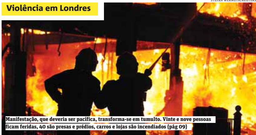
Manifestação, que deveria ser pacífica, transforma-se em tumulto. Vinte e nove pessoas ficam feridas, 40 são presas e prédios, carros e lojas são incendiados (pág 09)