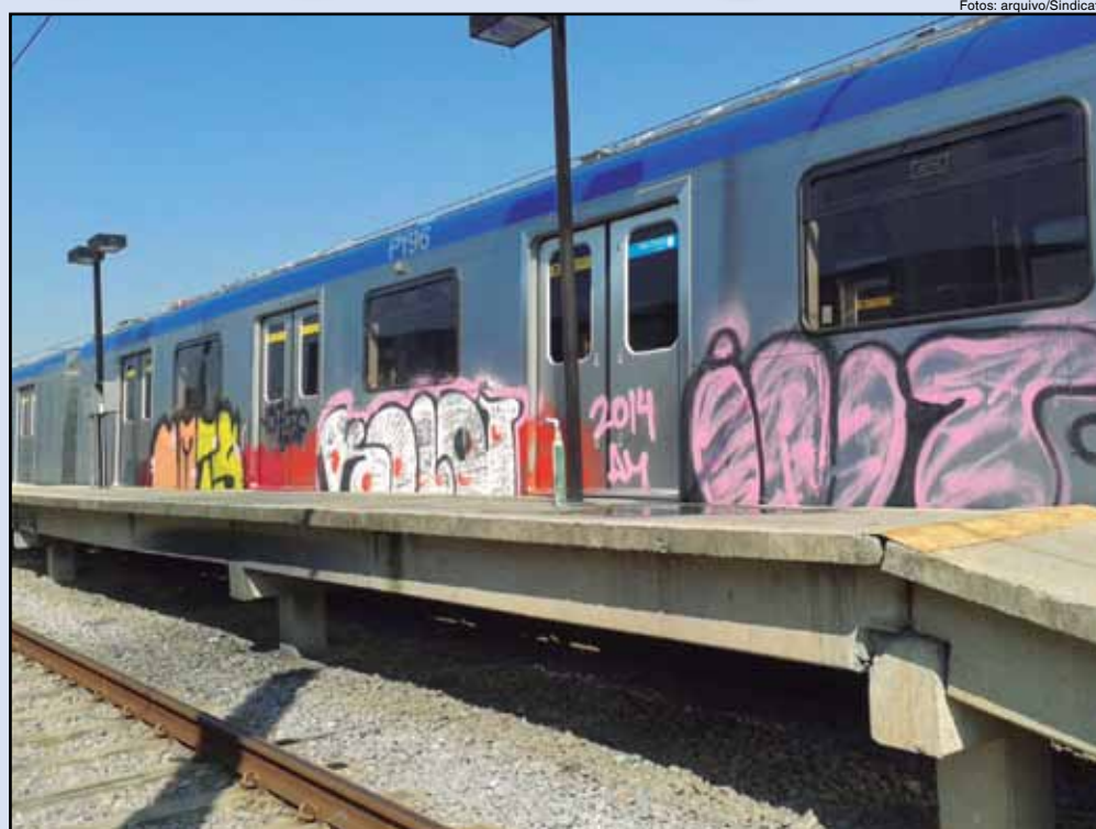
Trens paralisados são pichados no pátio do Capão Redondo

D oze trens estão sem utilização há mais de dois anos na Linha 5–Lilás. Eles usam a tecnologia CBTC e foram comprados nas licitações envolvidas no escândalo do cartel das empresas com o governo tucano, acusados de desviar R$ 2 bilhões. Isso segundo a denúncia da própria Siemens, uma das empresas envolvidas no cartel.