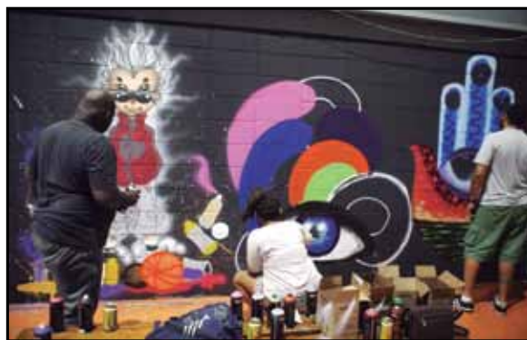
Atividade cultural agitou a noite de quinta