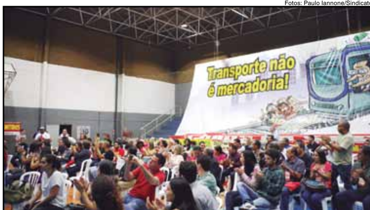
Abertura do Congresso ocorreu na sede do Sindicato

O plano de lutas tem como eixo a luta pela reintegração de todos os metroviários demitidos em consequência das lutas da categoria e contra as privatizações e terceirizações. Temas como a questão racial e LGBT, redução da jornada de trabalho, periculosidade para todo metroferroviário da operação, salário profissional nacional e o vagão exclusivo para as mulheres também foram aprovados pelos congressistas. O Congresso também deliberou pela manutenção da independência em relação à Central Sindical.