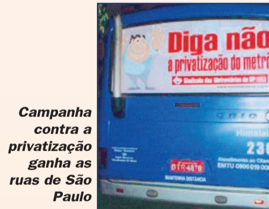
Campanha contra a privatização ganha as ruas de São Paulo

A vitória dos metroviários ao barrar o processo de licitação da Linha 4 - Amarela extrapolou as fronteiras do Metrô. Diante de nossas conquistas obtidas no TJ e TCE, o governo do estado e a direção da Sabesp congelaram o processo de licitação que previa a concessão da Estação de Tratamento de Águas (ETA) do Alto Tietê, até o desfecho do