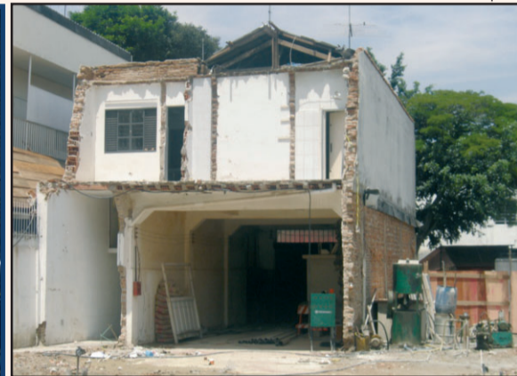
Fiscalização das obras da Linha 4 após desmoronamento do teto do túnel