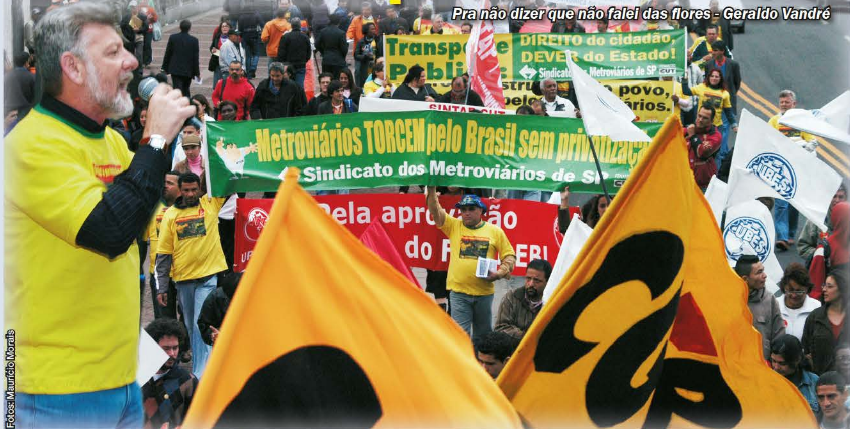
Godoi na passeata dos Movimentos Sociais denunciando a privatização da Linha 4 - Amarela

Pra não dizer que não falei das flores - Geraldo Vandré