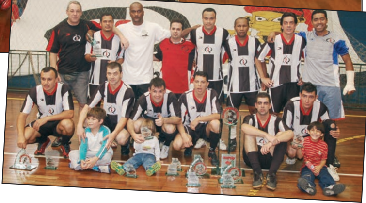
O grande campeão dá a volta Olímpica e recebe o troféu