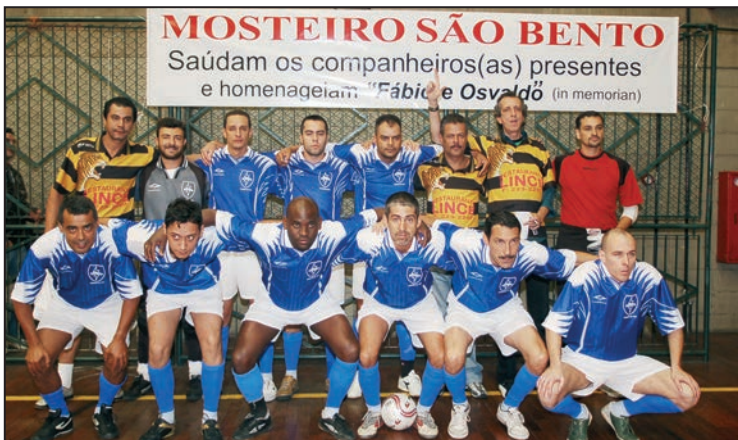
Vice campeão homenageia companheiros in memoriam

No último sábado, 9/12, Ilha Quadrada venceu a partida final do XIX Campeonato Metroviário de Futsal por 6 x 2, contra Mosteiro São Bento, que ficou com a segunda colocação. Os terceiro e quarto lugar ficaram com Carniceiro e Real Paulista, respectivamente, que terminaram o jogo com placar de 12 a 02.