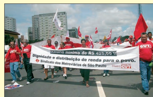
Metroviários na marcha em Brasília

Depois da mobilização de rua, que contou com a participação de mais de 25 mil trabalhadores de todo o país, no dia 7/12, representantes das centrais participaram de reunião com os ministros Luís Marinho, do Trabalho; Guido Mantega, da Fazenda; Paulo Bernardo, do Planejamento; Nelson Machado, da Previdência; e Luiz Dulci, da