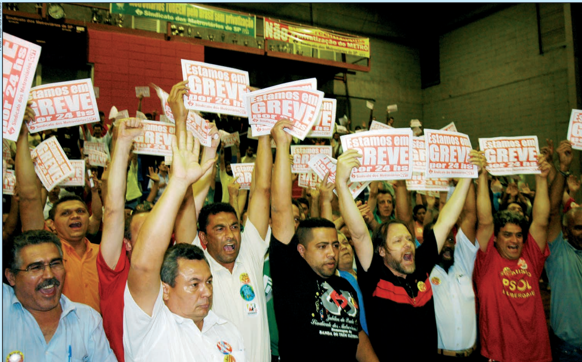
Assembléia que decidiu a greve de 24 horas contra a privatização da Linha 4 – Amarela