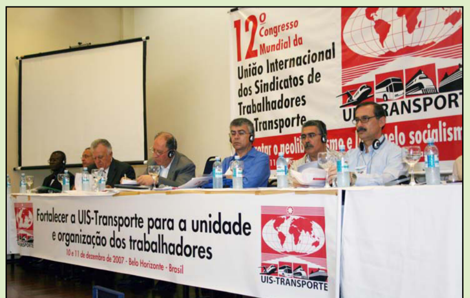
Organização dos trabalhadores de transporte de todo mundo na busca de mais direitos e garantias

“Além disso, há que se buscar um sistema integrado onde os diversos modais se complementem, trazendo benefícios sociais, econômicos e ambientais; contra a liberalização do setor, que através das privatizações e terceirizações provocam desemprego e precariedade no trabalho, degradando as condições de vida e trabalho que ampliam a desigualdade e a pobreza; pela defesa da dignidade dos trabalhadores e das suas condições de trabalho; e pela transformação do mundo com a construção de uma sociedade justa, solidária e de paz”.