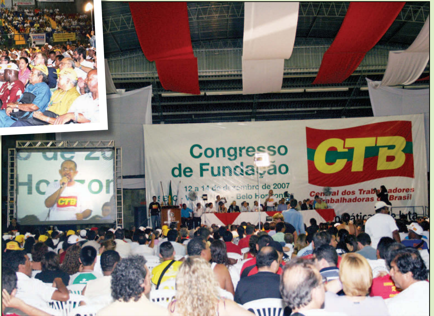
Delegações internacionais e de todo o Brasil participam da fundação da nova central em Belo Horizonte

Fundada durante congresso realizado em Belo Horizonte, entre os dias 12 e 14 de dezembro, contando com a participação de mais de 1.300 delegados de todo o país, além de diversas representações internacionais, a Central dos Trabalhadores e Trabalhadoras do Brasil (CTB) é a entidade que passará a fazer parte da luta dos trabalhadores pela garantia e ampliação de seus direitos