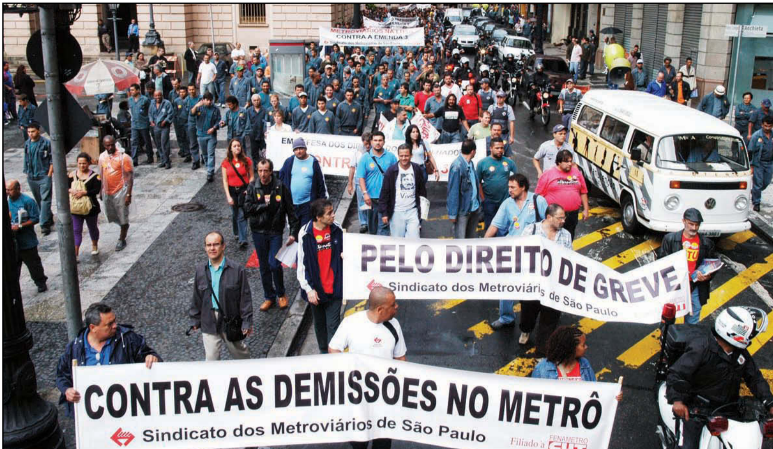
O Sindicato realizou diversas ações e manifestações pela reintegração dos metroviários demitidos

Conforme deliberação da assembléia realizada no dia 06/12, e depois de quatro meses da demissão em massa promovida pela Cia, o Sindicato apresenta para a categoria um balanço da situação dos companheiros que foram punidos por lutar pelos seus direitos. O Sindicato continuará usando todos os meios possíveis para conseguir alcançar seu objetivo de reintegrar os companheiros que foram demitidos injustamente.