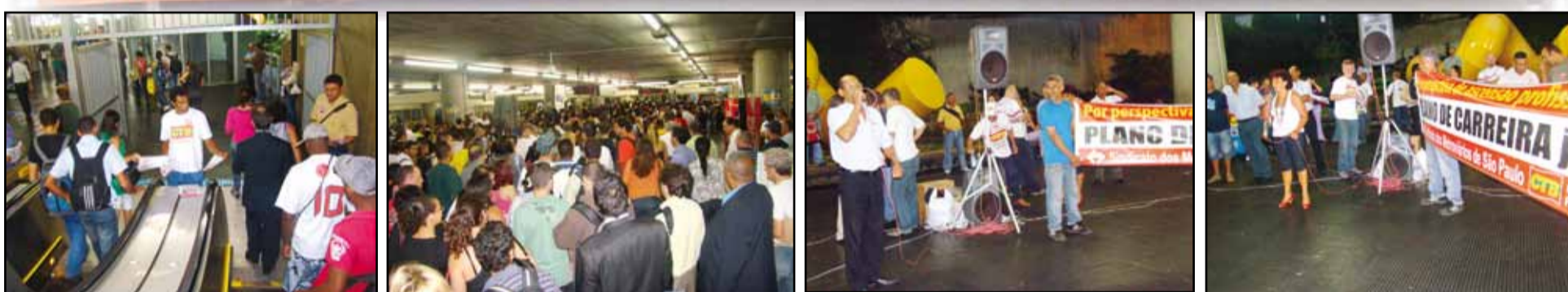
Ato realizado na estação Sé, dia 25/02, por plano de carreira