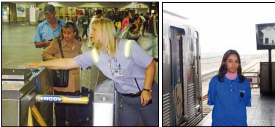
Funcionários enfrentam dificuldades para atuar na linha de bloqueios e PETs permanecem em plataformas por longos períodos