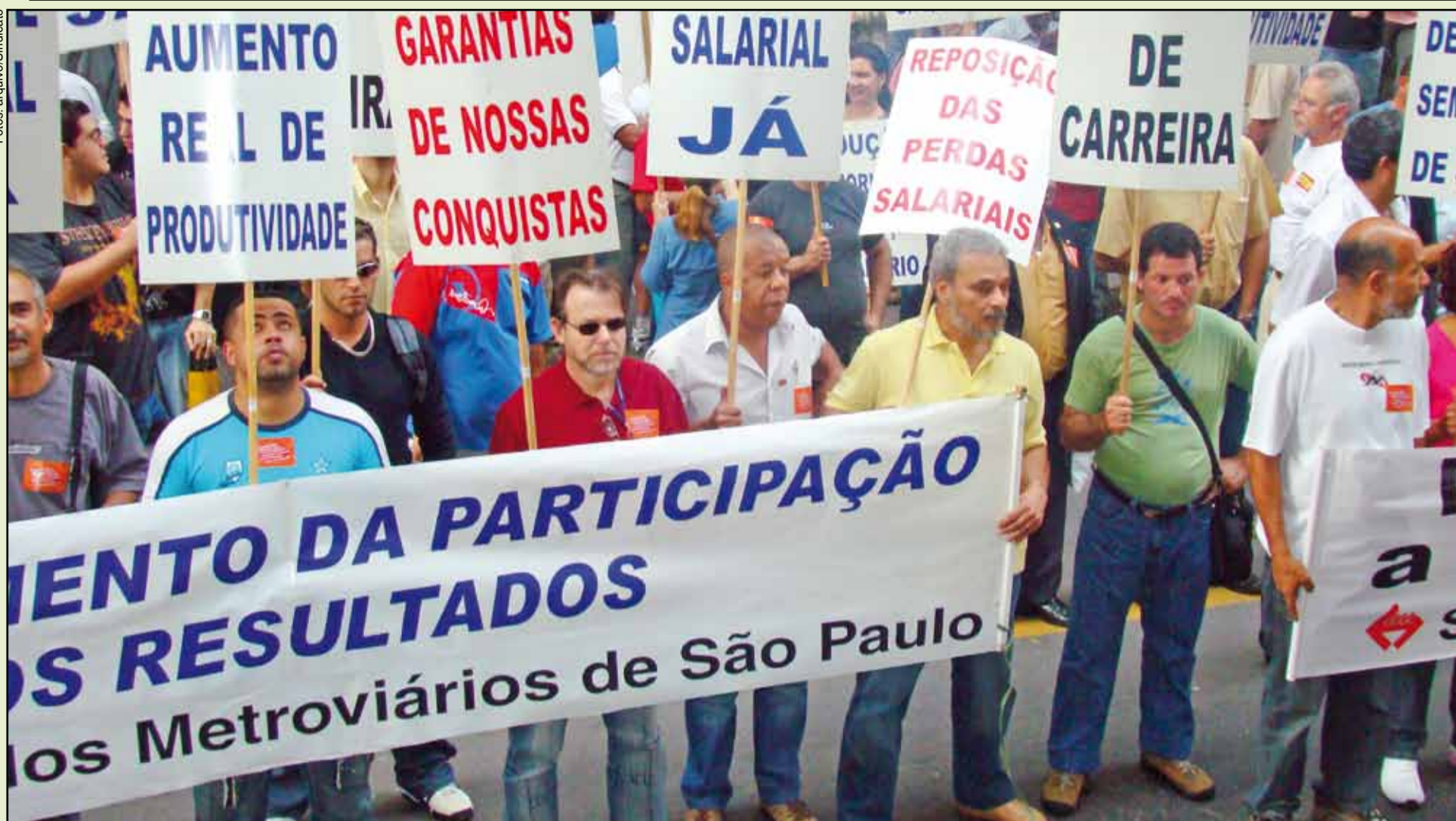
Manifestação dos metroviários em 2007 reivindicando a Participação nos Resultados