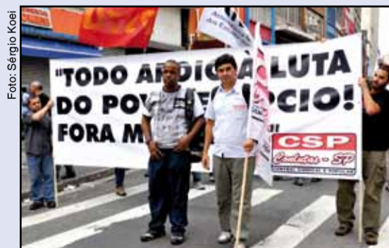
Acima: ato, no centro de São Paulo, exigindo a saída de Mubarak, do Egito. Ao lado: homenagem a Mohamed Bouazizi que ateou fogo ao corpo

Em São Paulo, no último dia 4, membros da direção do Sindicato, solidários à liberdade