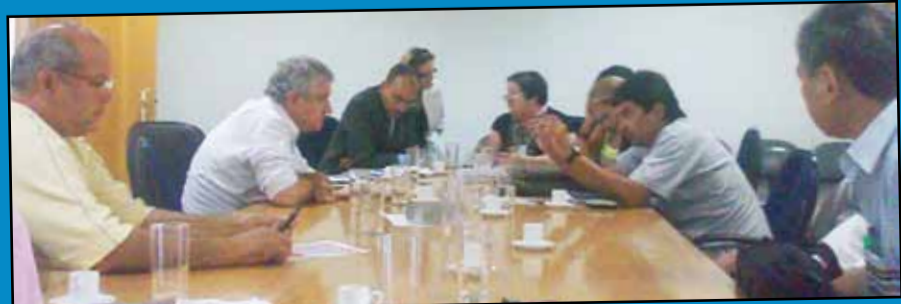
Reunião na SRTE, dia 08/02, pela suspensão do Plano da Cia.