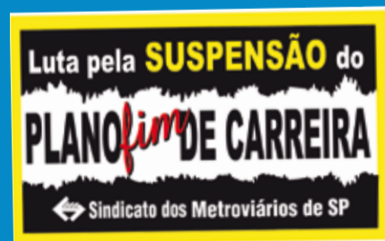
Adesivo da Campanha

O Metrô se comprometeu a apresentar todas as informações dia 18 de fevereiro próximo. A SRTE agendou nova mesa redonda dia 24/02.