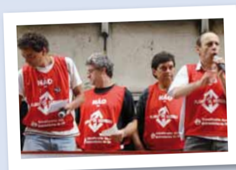
Cenas do ato pela suspensão do Plano de Carreira realizado em frente a Secretaria de Transportes Metropolitano, no Edifício Cidade II, no dia 20/01