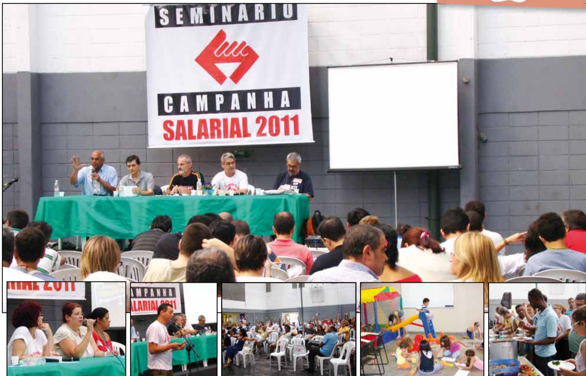
A participação da categoria no seminário foi fundamental para a organização da Campanha Salarial