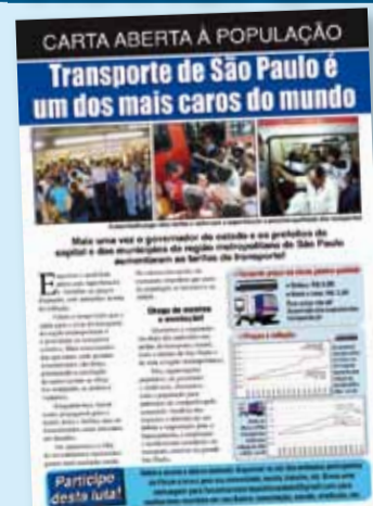
280 mil cartas à população foram distribuídas, para denunciar o aumento abusivo das tarifas