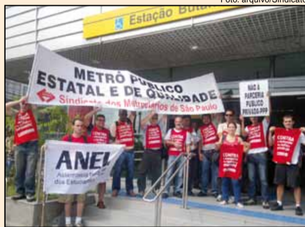
Manifestação contra a PPP na inauguração da estação Butantã, dia 28/03

outros sindicatos e diversas entidades dos movimentos sociais, para garantir o direito de locomoção dos cidadãos.