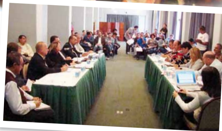
Primeira rodada de negociação, dia 05/05

A categoria deve acompanhar o desenrolar das negociações, manter-se organizada e unida! O bom resultado na campanha salarial depende muito da disposição de luta de cada um dos metroviários. Por isso, faça a sua parte!