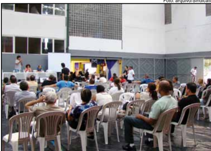
Assembleia realizada no dia 30/04 no Sindicato

Por este motivo, deliberou-se que uma nova assembleia seja convocada após o término da campanha salarial, para que o balancete financeiro seja submetido à aprovação categoria com tempo hábil para a sua devida avaliação.