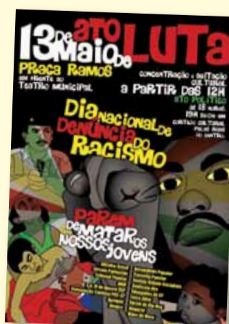
Cartaz de divulgação do ato

É preciso abolir os problemas do racismo, miséria, desigualdade, exploração e genocídio há tanto tempo enfrentados pela população pobre e negra! Diga não ao racismo!