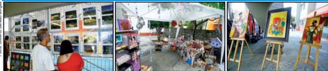
Exposição de fotos, artesanato e quadros fizeram parte do evento