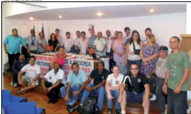
Participantes do Encontro Nacional Metroferroviário

Realizado no último sábado (4 de fevereiro), o Encontro Nacional Metroferroviário decidiu organizar uma Campanha Nacional Contra a Privatização. A campanha também vai exigir mais investimentos para o setor metroferroviário. O objetivo é que o governo federal direcione 2% do PIB do País para o setor de transportes metroferroviário.