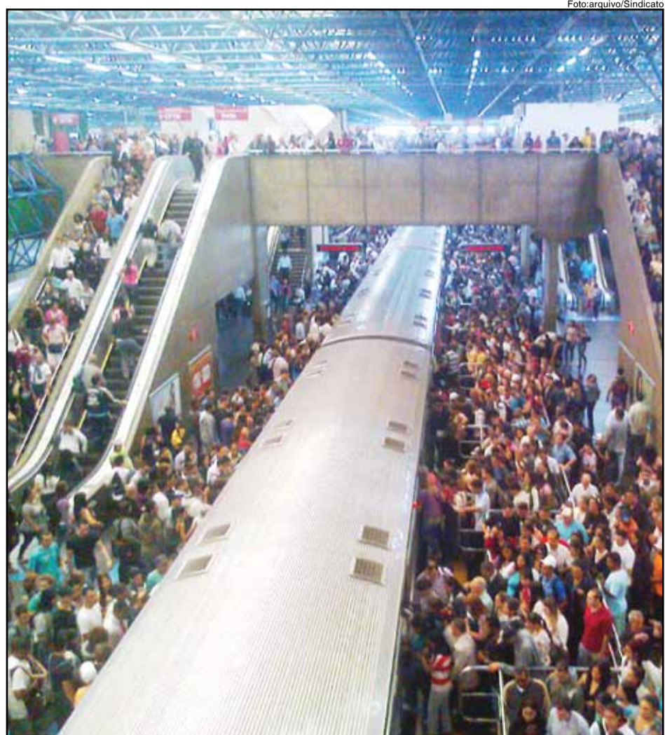
Os metroviários já atendem 5 milhões de usuários dia