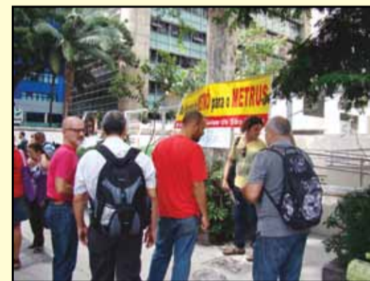
Ato contra o aumento, dia 19 de fevereiro, em frente a sede no Metrô