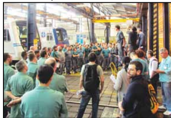
Setorial extraordinária realizada no PAT JAB, dia 7/2