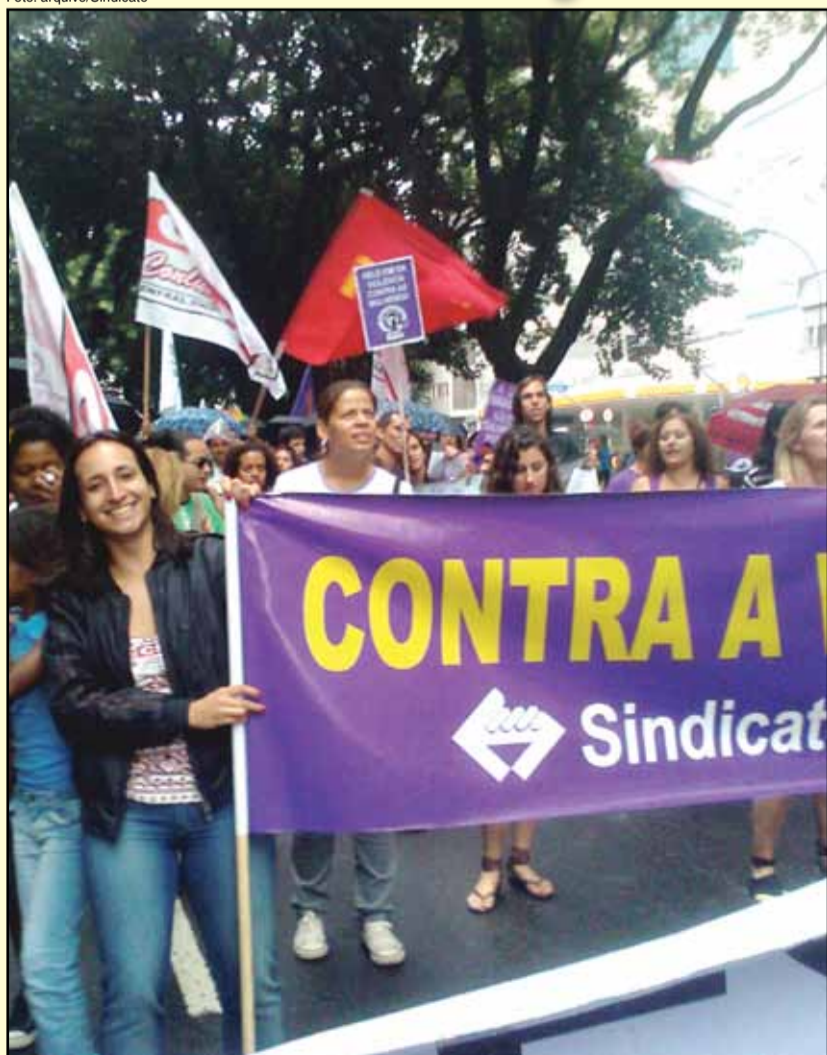
Metroviárias em manifestação de mulheres na Praça da Sé

No dia 8 de março de 1857 na fábrica Cotton, nos EUA, 129 trabalhadoras foram assassinadas queimadas, quando estavam em greve, lutando por equiparação salarial com os homens e redução da jornada de trabalho