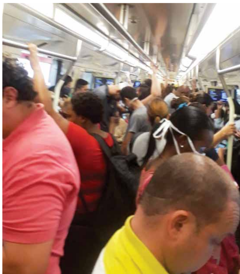
Metrô lotado em tempos de coronavírus