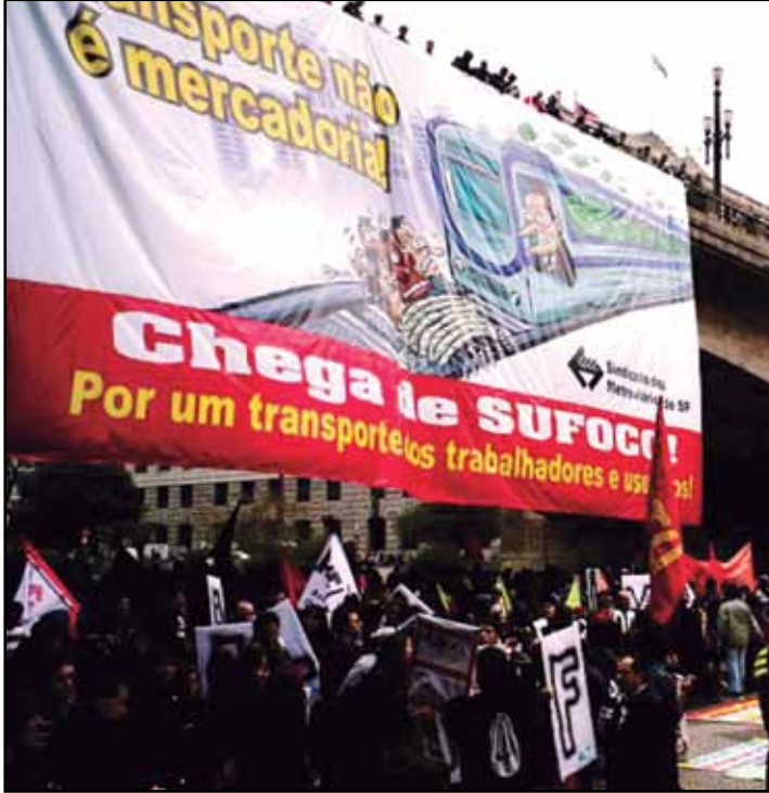
Manifestação pela melhoria nos transportes

N a semana passada, os rodoviários do Rio, Belém, Florianópolis, ABC e Campinas fizeram greves por seus direitos. Em nível nacional, os metroviários estão lutando contra a privatização da CBTU.