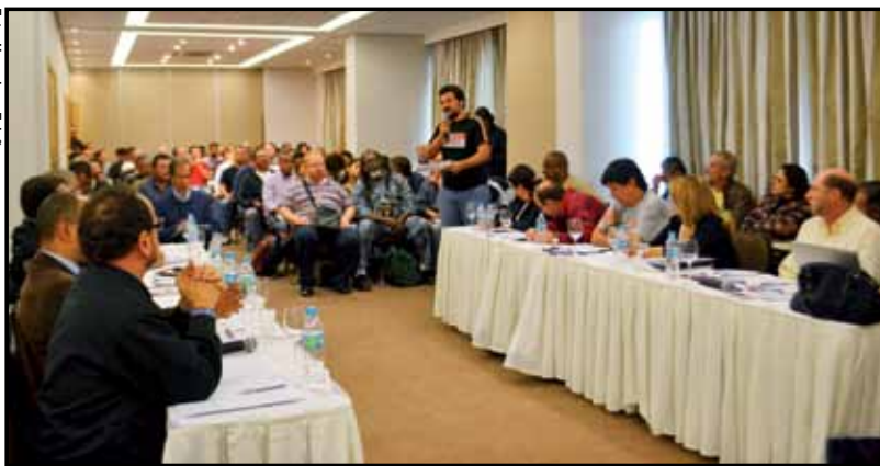
Primeira reunião de negociação aconteceu no dia 4/5/2012

Há um calendário de negociações com a empresa, com reuniões hoje e nos dias 10, 14 e 16 de maio. Nós, trabalhadores do Metrô, vamos insistir no diálogo para alcançar nossos