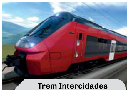
Trem Intercidades Tarifa será de R$ 64

Junto com o leilão da Linha 7, haverá o leilão do novo trem intercidades, que vai interligar São Paulo a Campinas. Defendemos a construção de mais trens públicos e estatais, porém, este trem intercidades vai ser bancado pelo dinheiro que a concessionária vai arrecadar com a privatização da Linha 7, é uma vergonha!